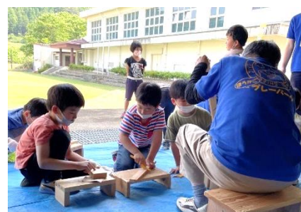
▼夏休みプレーパーク