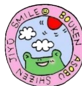
▼放課後プレーパーク

冒険心・好奇心を大切にするために、可能な限り禁止事項をなくし、のびのびと遊べるように心がけています。「教える」のではなく、遊びの素材やヒントを提供し、安全に遊べるように見守ります。