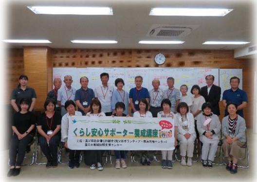
▲暮らし安心サポーター養成講座