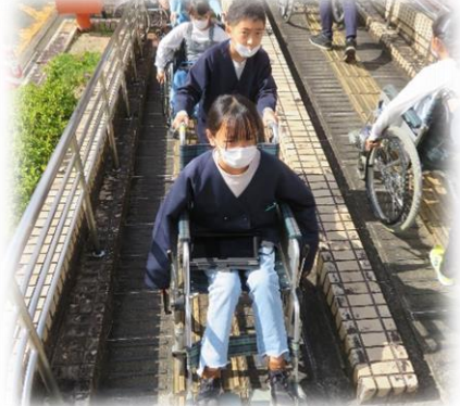
▲広谷小学校福祉学習(車いす体験)