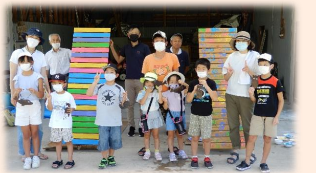
▲みんなでカラフルな「つどい場ベンチ」に仕上げました(=令和4年7月24日、養父校区自治協議会)

みなさまから寄せられた募金は、「新しい生活様式」の実践として、地域における“つながらり活動”のための「屋外用ベンチ」の購入・設置に活用いたします。